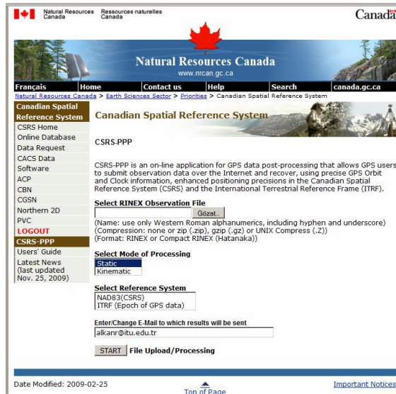
Şekil 7: CSRS-PPP servisinin internet sayfası ( http://webapp.csrn.nrcan.gc.ca/field/Scripts/CSRS_PPP_main_e.pl )

CSRS-PPP servisinin internet sayfasına http://webapp.csrn.nrcan.gc.ca/field/Scripts/CSRS_PPP_main_e.pl adresinden ulaşılmaktadır (Şekil 7).